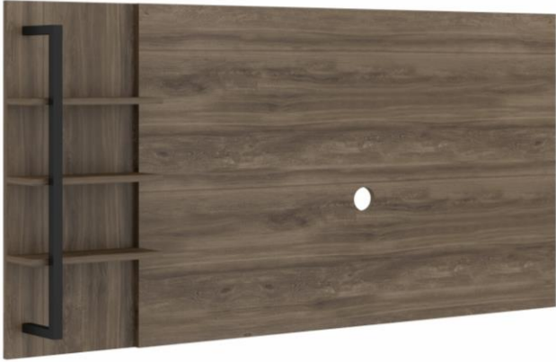
Legno com Tubo Preto