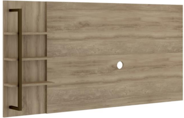
Noce com Tubo Ouro Velho